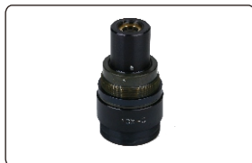
5X, 20X, 50X, 100X物镜